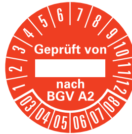
PRP 35-31 RT