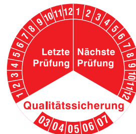
PRP 35-25 RT

Sonderanfertigung mit Firmenzeichen oder angepaßten Prüfintervalen sind möglich. Individuelle Erstellung von Prüfplaketten siehe auch PPT für Thermotransferdrucker Seite 44.