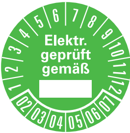
PRP 35-27 GN